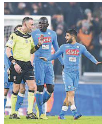
Valeri circondato dagli azzurri